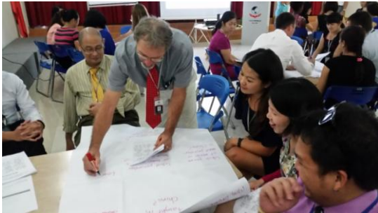
Giáo viên – giảng dạy – Giáo viên

Chúng tôi khuyến khích các bậc cha mẹ theo dõi và tham gia vào giáo dục con em mình để giúp các em thực hiện tốt các quy định của trường.