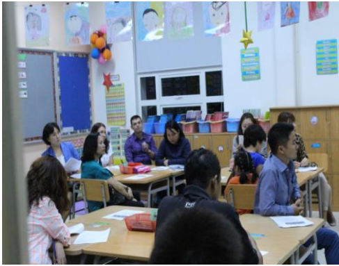
Ngày Hội thông tin