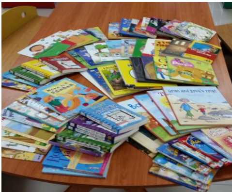
Sách ủng hộ cho thư viện trường