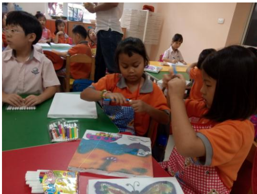
Các em học sinh trong Lớp học vẽ