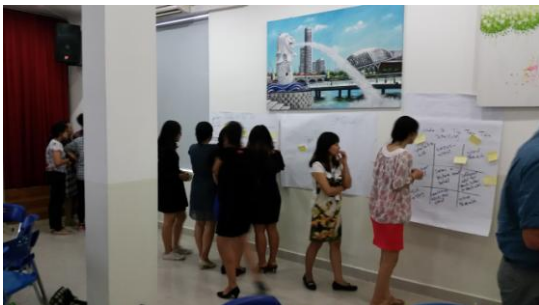
Chương trình phát triển chuyên môn cho giáo viên.