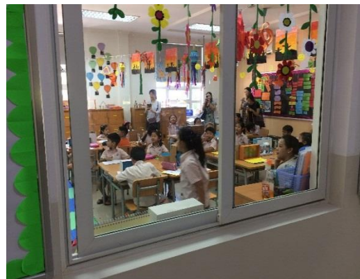
Tuần lễ STEM được tổ chức từ ngày 17-21 tháng Chín, phụ huynh cùng các em có cơ hội nhìn lại các dự án đã làm.