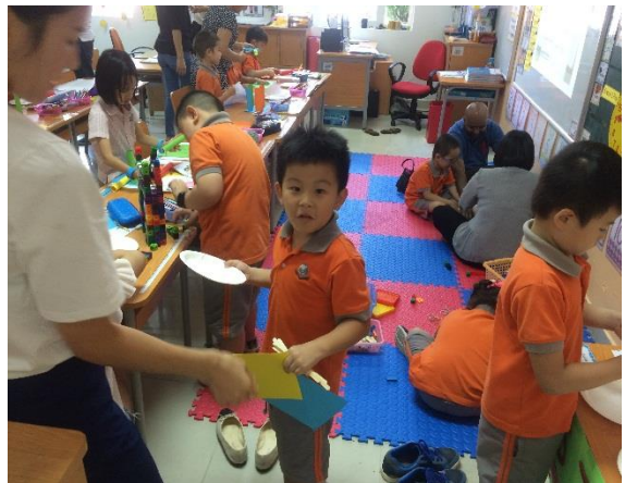
Trong tuần lễ STEM phụ huynh được xem các em thuyết trình về dự án của mình.