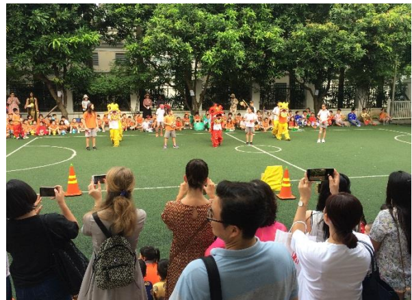
Các em học sinh lớp lớn múa lân trong lễ hội Trung Thu

Tôi mới đọc được câu chuyện này và rất muốn chia sẻ nó với Quý Phụ huynh.