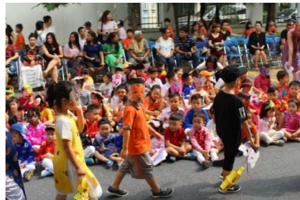
Học sinh mặc trang phục truyền thống, đeo mặt nạ, tham gia rước đèn lồng.