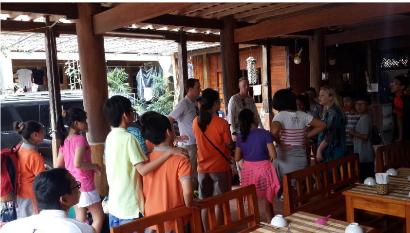
Đoàn làm thủ tục nhận phòng tại nhà sàn