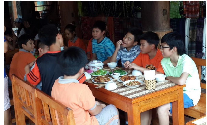
Bữa trưa đầu tiên của các em học sinh tại Mai Châu