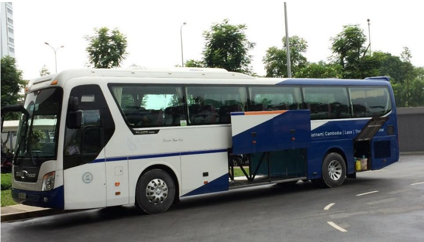
Đoàn xe xuất phát từ SIS @ Gamuda Gardens