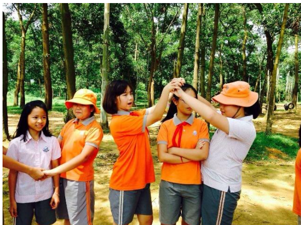
Thăm quan khu sinh thái Sơn Tinh

Xin được gửi lời cảm ơn chân thành tới tất cả các thầy cô giáo và những học sinh thân yêu, những người đã góp phần tạo nên sự