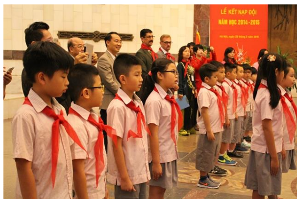
Lễ kết nạp Đội viên thiếu niên tiền phong Hồ Chí Minh