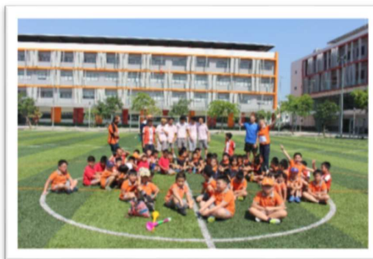
Các thành viên trong đội bóng đá của trường SIS Ciputra đã chụp ảnh lưu niệm tại giải bóng đá giao hữu.