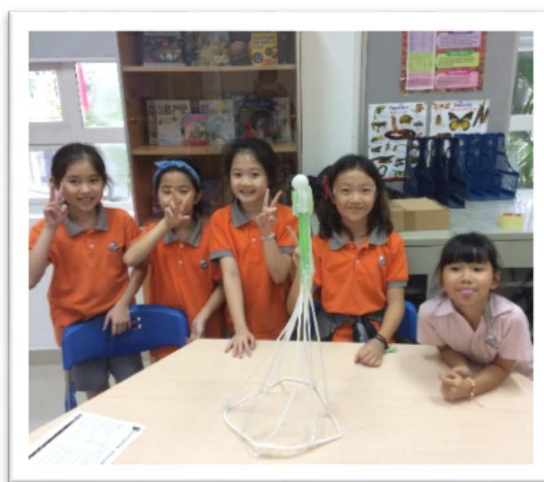
Với thách thức dựng tòa tháp cao từ 40 ống hút và có thể đặt được một quả bóng bàn trên đỉnh tháp. Các em trong câu lạc bộ STEM đã cùng nhau hoàn thiện dự án của mình trong niềm vui thích thú.