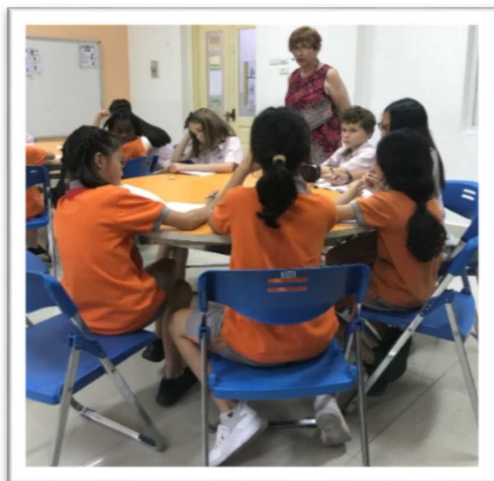
Trong buổi gặp gỡ với Tiến sỹ Sally Murphy, cô đã nhấn mạnh với các em học sinh từ lớp 4 đến lớp 6 về tầm quan trọng của việc đọc và viết, từ đó các em đã bắt đầu tự tay viết nên những câu chuyện của mình.