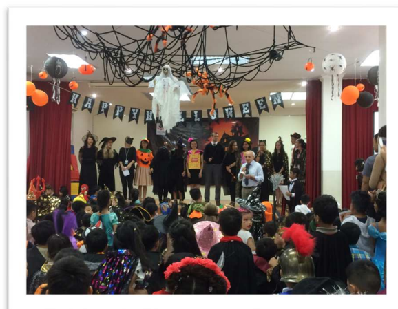
Các thầy cô cùng các em học sinh SIS Ciputra tổ chức Lễ hội Hóa trang trong những trang phục đặc sắc.