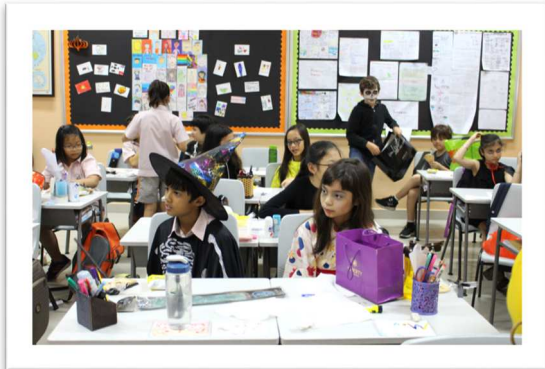
Lễ hội Halloween tại lớp 4 quốc tế thật là vui!