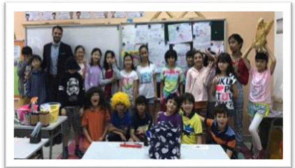
Các bạn học sinh lớp 5 Quốc tế đã chụp ảnh lưu niệm “Ngày Tươi Sáng”