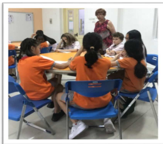
Trong buổi gặp gỡ với Tiến sỹ Sally Murphy, cô đã nhấn mạnh với các em học sinh từ lớp 4 đến lớp 6 về tầm quan trọng của việc đọc và viết, từ đó các em đã bắt đầu tự tay viết nên những câu chuyện của mình.