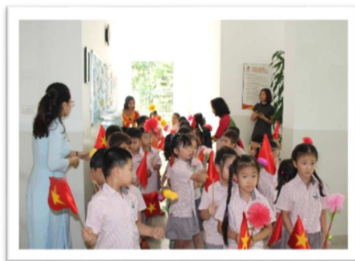
(Trên và dưới) Học sinh khối song ngữ trong buổi lễ kỷ niệm 64 năm, ngày giải phóng thủ đô Hà Nội.

Với sự nhiệt tình yêu nghề mến trẻ, sự đổi mới trong phương pháp giảng dạy của đội ngũ giáo viên, sự ủng hộ thường xuyên và liên tục của Quý Phụ huynh, cộng với sự tích cực học tập và tự rèn luyện của học sinh trong năm học này, tôi tin tưởng rằng tất cả chúng ta sẽ có một năm học tuyệt vời phía trước.