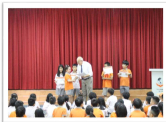
Các em học sinh tiêu biểu trong tháng nhận bằng khen.