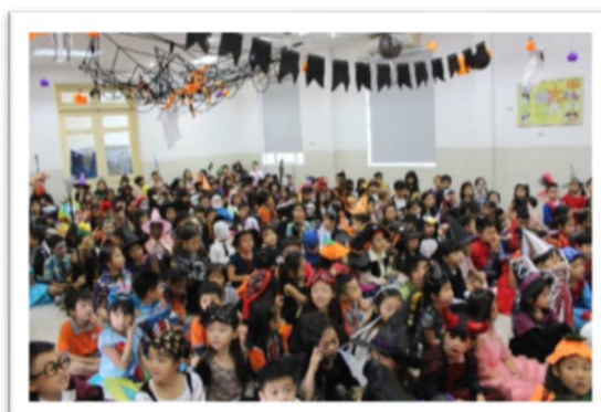
(Trên và Dưới) Tại buổi sinh hoạt toàn trường, sáng nay 31 tháng Mười 2018, tập thể SIS Ciputra tổ chức lễ Hội hóa trang với nhiều trang phục khác nhau.